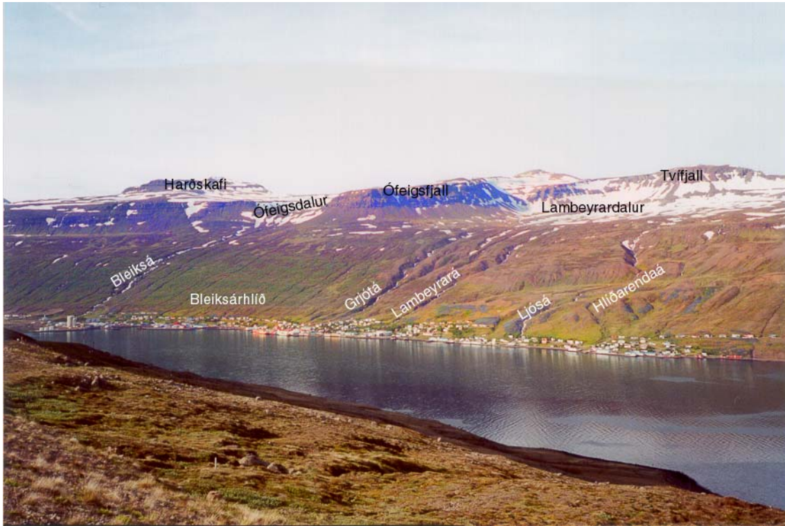
Mynd 1: Eskifjörður. Helstu örnefni.